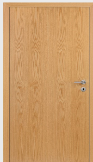
Ilustrace: Dřevěné interiérové dveře ve skrytém falcovém provedení se skrytými panty s dubovou lakovanou dýhou svíslé